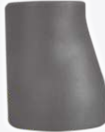
TSE 2649 TSE 10253-1 KT-7 REDÜKSİYON